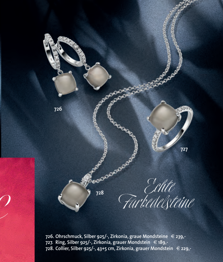
726. Ohrschmuck, Silber 925/-, Zirkonia, graue Mondsteine € 239,- 727. Ring, Silber 925/-, Zirkonia, grauer Mondstein € 189,- 728. Collier, Silber 925/-, 43+5 cm, Zirkonia, grauer Mondstein € 229,-