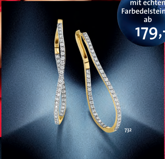
732. Ohrschmuck, Silber 925/-, gelb vergoldet, Zirkonia € 249,-

Ringe mit echten Farbedelsteinen ab 179,-