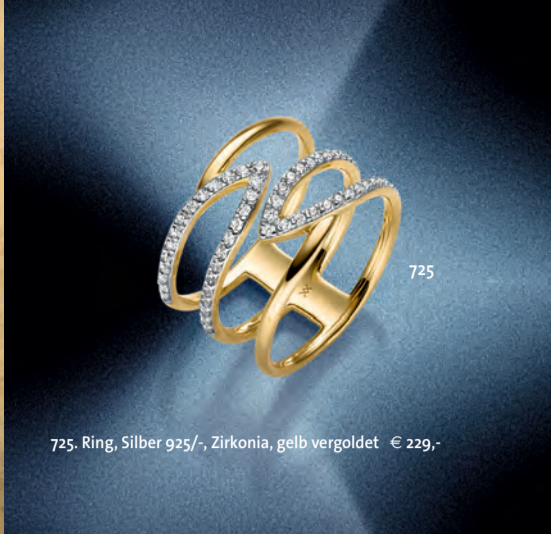
725. Ring, Silber 925/-, Zirkonia, gelb vergoldet € 229,-