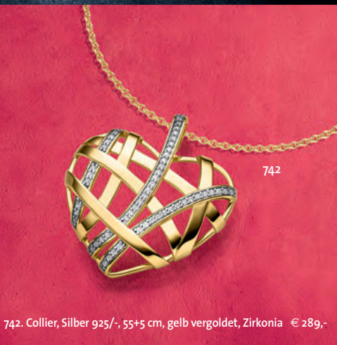
742. Collier, Silber 925/-, 55+5 cm, gelb vergoldet, Zirkonia € 289,-